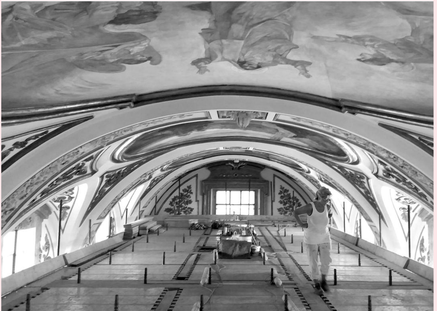
La volta del Santuario, ripulita e restaurata.